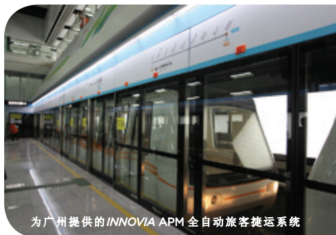
为广州提供的INNOVIA APM全自动旅客捷运系统