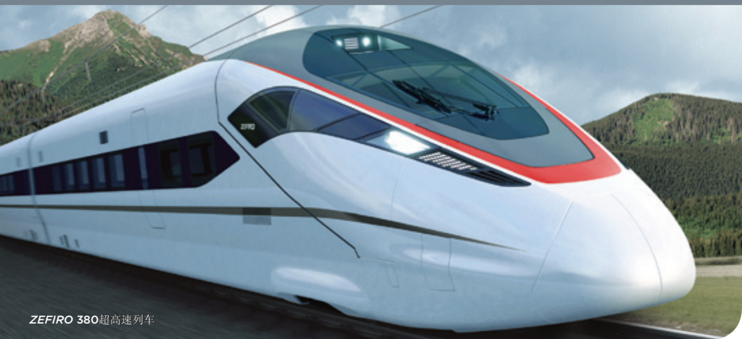
ZEFIRO 380 超高速列车

庞巴迪运输集团在发展中国城市轨道交通和先进铁路网络方面，长久以来一直发挥着重要的作用。如今，庞巴迪通过在中国的合资企业和独资企业，正在积极地传递着业界领先的技术和成熟的管理理念。我们与中方合作伙伴携手，为中国的主要城市提供最先进的轨道运输解决方案和服务，产品从地铁车辆到超高速列车，应有尽有。