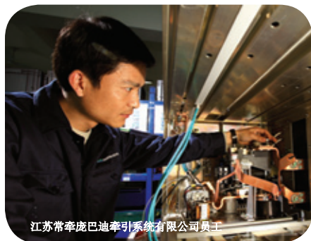
江苏常牵庞巴迪牵引系统有限公司员工