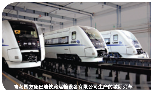
青岛四方庞巴迪铁路运输设备有限公司生产的城际列车