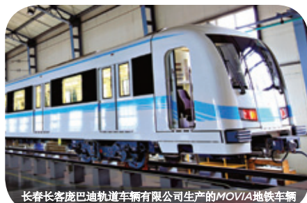
长春客庞巴迪轨道车辆有限公司生产的MOVIA地铁车辆

2013年 2013年，庞巴迪运输集团及江苏常牵庞巴迪牵引系统有限公司分别与南京南车浦镇城轨车辆有限公司签订合同，共同为苏州提供18列100%低地板现代有轨电车，并为南京提供15列100%低地板无接触网现代有轨电车。申通庞巴迪（上海）轨道交通车辆维修有限公司与上海申通地铁集团有限公司签订合同，为上海地铁7号线与9号线的498辆车提供大修服务。同年，庞巴迪运输集团及江苏常牵庞巴迪牵引系统有限公司签订合同或中标将为长春、深圳、佛山、合肥等地共计近1000辆地铁车辆提供牵引系统。