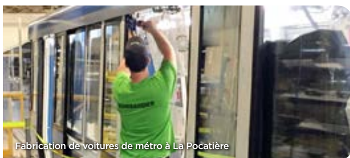
Fabrication de voitures de métro à La Pocatière

Mise en service de l'avion Global 7500 le 20 décembre 2018