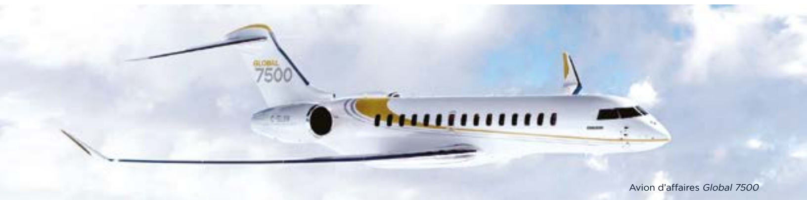
Avion d'affaires Global 7500

Potentiel de croissance annuelle du marché de 2,6% jusqu'en 2023