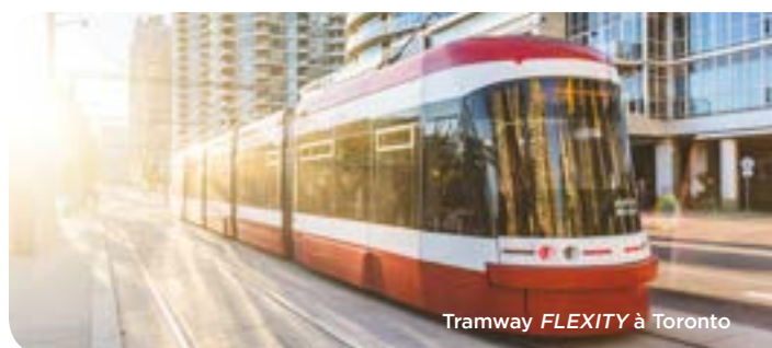
Tramway FLEXITY à Toronto